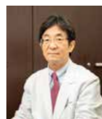
新村 健 総合診療内科学 主任教授

募集期間 2023年11月27日～2024年1月19日 実施者 新村 健 (兵庫医科大学 医学部 総合診療内科学 主任教授) 目標金額 第1目標 3,000,000円 第2目標 6,000,000円 第3目標10,000,000円 募集形式 寄付金控除型/All or Nothing形式 資金の用途 血液中の長寿因子を見つけ出すための特殊検査、コホート研究の運営費