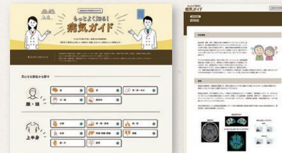
気になる部位 検索ページ