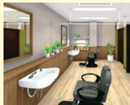
理美容室 ANCS(アックス)