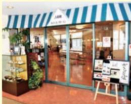
2番館カフェレストラン

新型コロナウイルス感染拡大防止のため、一部の店舗で営業時間等を変更しております。 最新情報は、病院WEBサイトの「お知らせ」ページをご確認ください。