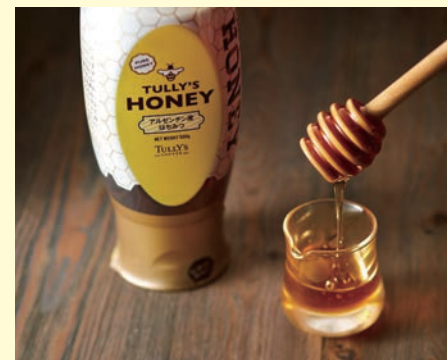
タリーズハニー 500g 1,101円

人気ドリンク「ハニーミルクラテ」に使用している香り豊かなはちみつ。コーヒー・紅茶はもちろん、ヨーグルトにもおすすめです。