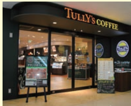
タリーズコーヒー