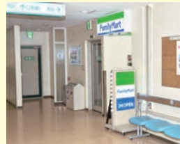
ファミリーマート