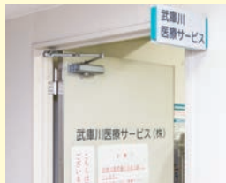
武庫川医療サービス

営業時間：月～金 8時30分～16時45分 第1・3土曜日 8時30分～12時30分 休業日：病院休診日