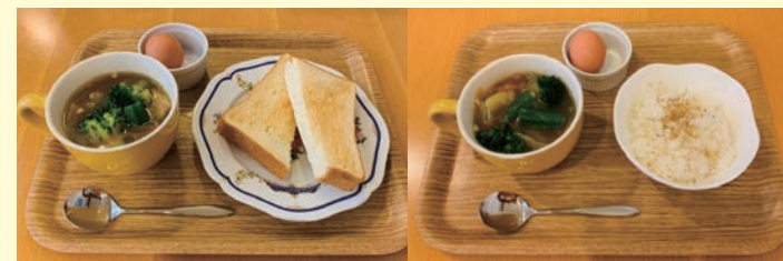
食べる野菜スープセット 野菜スープ・ゆで卵・トーストまたはご飯 520円

こちらのセットをご注文の方 プラス 250円 コーヒーまたは紅茶、 プラス 300円 アイスコーヒーまたはアイスティー を追加できます。