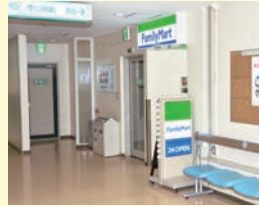
ファミリーマート