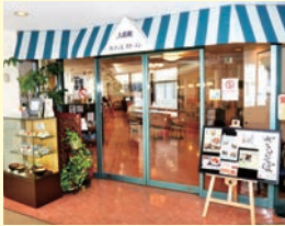
2番館カフェレストラン

新型コロナウイルス感染拡大防止のため、一部の店舗で営業時間等を変更しております。 最新情報は、病院WEBサイトの「お知らせ」ページをご確認ください。