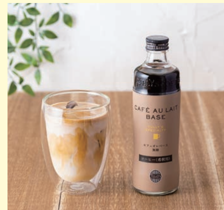
Tully's Specialty カフェオレベース 300ml 1,188円

無糖タイプで7倍希釈のカフェオレベース。お好みではちみつを加えたり、豆乳で割ってソイカフェオレでも。