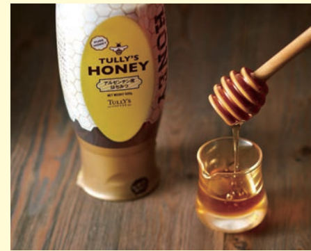
タリーズハニー 500g 1,101円

人気ドリンク「ハニーミルクラテ」に使用している香り豊かなはちみつ。コーヒー・紅茶はもちろん、ヨーグルトにもおすすめです。