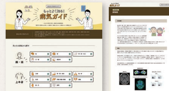
気になる部位 検索ページ