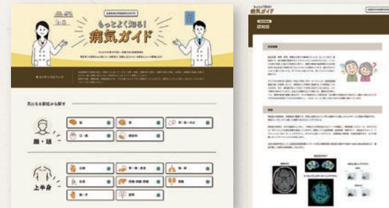
気になる部位 検索ページ