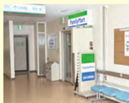
ファミリーマート