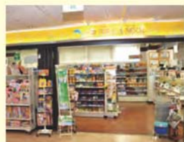
売店 ドウラ・メール