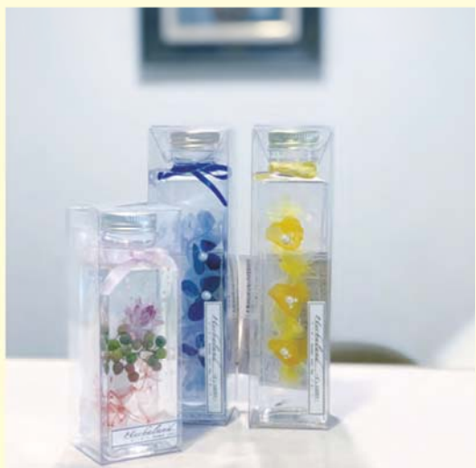
Herbarium (ハーバリウム) 1,980円～