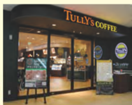
タリーズコーヒー