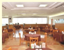
レストラン ROYAL(ロイヤル)

ファミリーマートでは、冷麺、お弁当、おむすび、パスタやデザートに加え、人気の「ファミチキ」や「やきとり」などのホットスナック系商品も好評販売中!