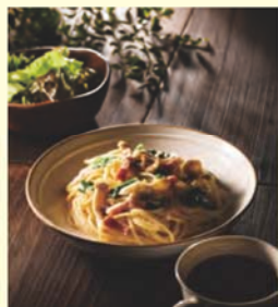
ペコリーノロマーノ 香る3種のチーズパスタ