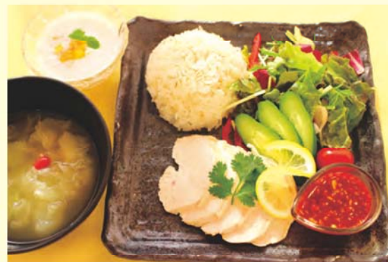
カオマンガイ(茹鶏のサラダご飯) 1200円(1日30食限定)

6月よりヘルシーメニュー第7弾として「カオマンガイ(茹鶏のサラダご飯)」を平日のみ、1日限定30食提供しています。