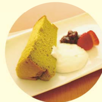
抹茶シフォンケーキが登場!

ティータイムのケーキセットメニューに「抹茶シフォンケーキ」が加わりました。甘さ控えめで濃い抹茶の風味が、コーヒー・紅茶によく合います!