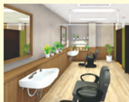
理美容室 ANCS(アックス)

営業時間: 月~金、第1・3土曜日 8時40分~17時40分 休業日: 病院休診日