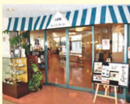
2番館カフェレストラン

営業時間: 平日 8時30分~16時 第1・3土曜日 8時30分~14時 休業日: 病院休診日