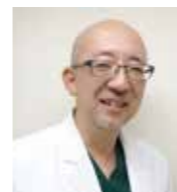
兵庫医科大学 麻酔科学・疼痛制御科学講座 教授