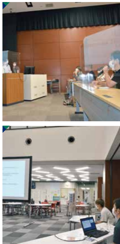
グループ発表の様子