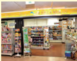
売店 ドウラ・メール