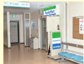
ファミリーマート