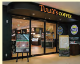
タリーズコーヒー