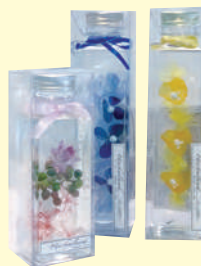
Herbarium (ハーバリウム) 1,980円～

ハーバリウムとは植物標本のこと。専用のオ イルにドライフラワーなどを浸すことで、色 鮮やかな状態をキープ。生花よりも、かなり長 い期間観賞を楽しめます。病室やお部屋をお しゃれに演出してくれますよ♪