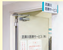
武庫川医療サービス

営業時間: 月~金 8時30分~16時45分 第1・3土曜日 8時30分~12時30分 休業日: 病院休診日