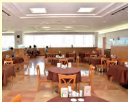
レストラン ROYAL(ロイヤル)

ファミリーマートでは、お弁当、おむすび、パスタやデザートに加え、人気の「ファミチキ」や「やきとり」などのホットスナック系商品も好評販売中!