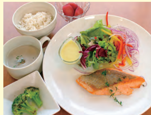
鮭のソテー マヨドレソース