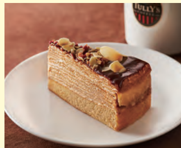
カラメルミルクレープ

カスタードプリンをイメージしたクリームの上に、味わい豊かな洋栗を使ったモンブランクリームをデコレーション。