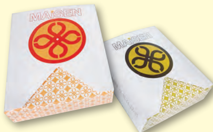
エビかつサンド・ヒレかつサンド 421円～

「ヒレかつサンド」をはじめ、サンドイッチや各種ミニ バーガーの販売を行っています。ぜひご賞味ください。