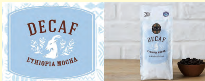
デカフェエチオピア モカ(コーヒー豆)

エスプレッソビバレッジ商品をプラス60円(+税)にてやさしい苦味のカフェインレスに変更できます。