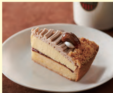
イタリアンモンブラン プディングタルト