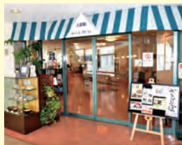
武庫館カフェレストラン

営業時間: 平日 8時30分~16時 第1・3土曜日 8時30分~14時 休業日: 病院休診日