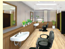
理美容室 ANCS(アックス)

営業時間: 月~金、第1・3土曜日 8時40分~17時40分 休業日: 病院休診日