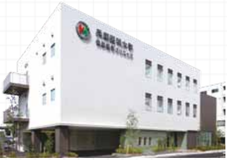
(本誌裏表紙をご覧ください)

兵庫医科大学病院に隣接しており、兵庫医科大学の現役教員などベテランの医師および医療スタッフによる診察や各種検査、結果説明などを行っています。