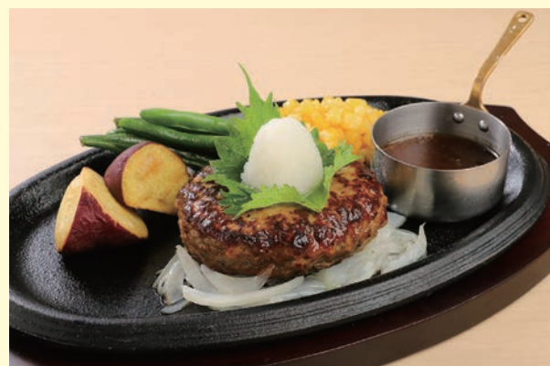
黒毛和牛と黒豚のハンバーグ 和風おろしソース 1,280円