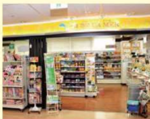
売店 ドウラ・メール