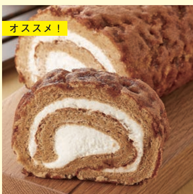
ざらめ醤油ロール 500円