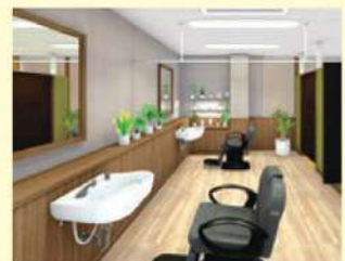
理美容室 ANCS(アックス)