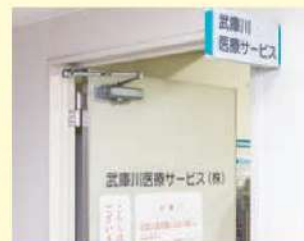
武庫川医療サービス

営業時間：月～金 8時30分～16時45分 第1・3土曜日 8時30分～12時30分 休業日：病院休診日