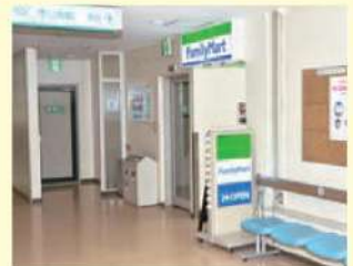
ファミリーマート