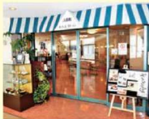
貳番館カフェレストラン

営業時間：平日 8時30分～16時 第1・3土曜日 8時30分～14時 休業日：病院休診日