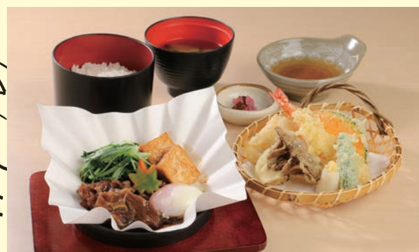
黒毛和牛のすき焼き御膳 1,980円