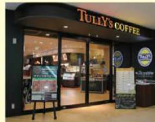
タリーズコーヒー