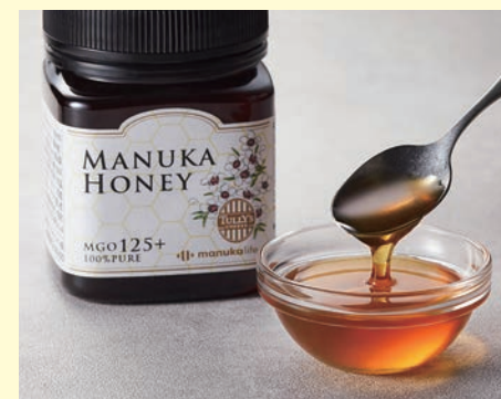
マヌカハニー 250g 3,780円

人気ドリンク「ハニーミルクラテ」に使用して いる香り豊かなはちみつ。コーヒー・紅茶は もちろん、ヨーグルトにもおすすめです。