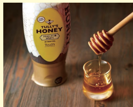
タリーズハニー 500g 1,101円

人気ドリンク「ハニーミルクラテ」に使用して いる香り豊かなはちみつ。コーヒー・紅茶は もちろん、ヨーグルトにもおすすめです。