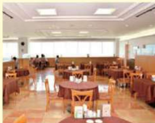
レストラン ROYAL(ロイヤル)

新型コロナウイルス感染拡大防止のため、一部の店舗で営業時間等を変更しております。 最新情報は、病院WEBサイトの「お知らせ」ページをご確認ください。