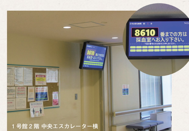
1号館2階 中央エスカレーター横

以前まで、1号館3階の採血室前の廊下は採血をお待ちの患者さんで混み合う場合もあり、ご不便をおかけしておりました。そこで、2020年11月に、混雑緩和を目的に1号館2階に新しく「採血状況モニター」を設置し、2階でもお待ちいただけるようにいたしました。ぜひご利用ください。