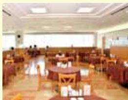
レストラン ROYAL(ロイヤル)