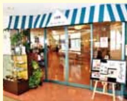
三番館カフェレストラン

営業時間: 平日 8時30分~16時 第1・3土曜日 8時30分~14時 休業日: 病院休診日