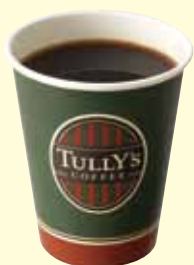
本日のコーヒー ※セット対象ドリンク