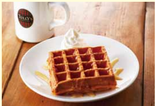
モーニングワッフル (販売時間 7:30~11:30)