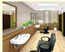
理美容室 ANCS(アックス)

営業時間: 月~金、第1・3土曜日 8時40分~17時40分 休業日: 病院休診日