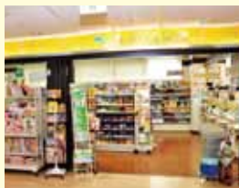
売店 ドウラ・メール