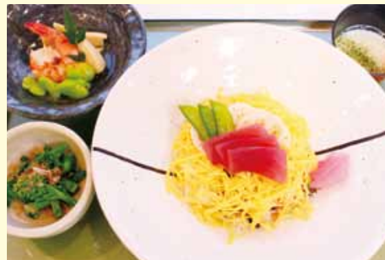
春のちらし寿司 1,200円(1日30食限定)

3月よりヘルシーメニュー第6弾として「春のちらし寿司」 を平日のみ、1日限定30食提供しています。