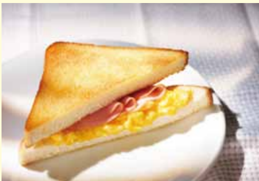
ホットサンド ハム&スクランブルエッグ