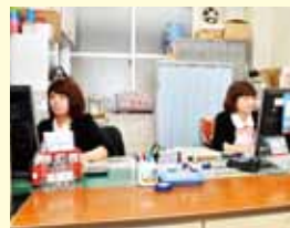
武庫川医療サービス

営業時間: 月~金 8時30分~16時45分 第1・3土曜日 8時30分~12時30分 休業日: 病院休診日