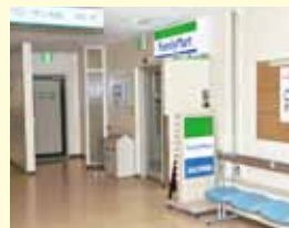
ファミリーマート