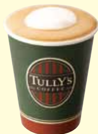
カフェラテ ※セット対象ドリンク